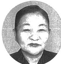
森脇社長 学心の心、モノづくりの精神の醸成に一役買えたらと思う。