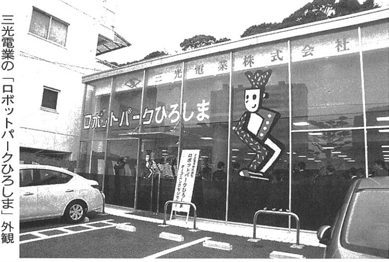
三光電業の「ロボットパークひろしま」外観