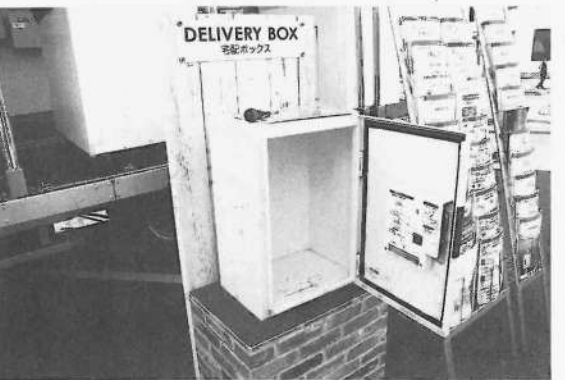
日東工業は一戸建て住宅向けの宅配BOXを紹介した