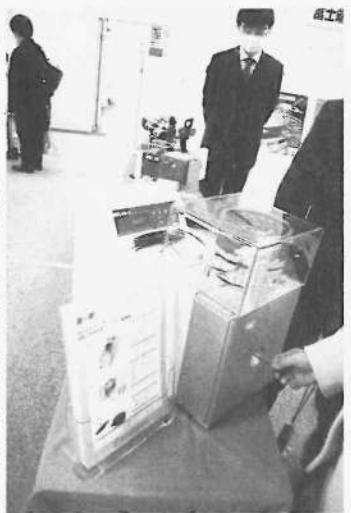
富士端子工業は自動圧着機を提案した

東洋技研は端子台、リレーターミナルなどを展示。新製品の短穴アルミレールと手動式アルミレール用カッター