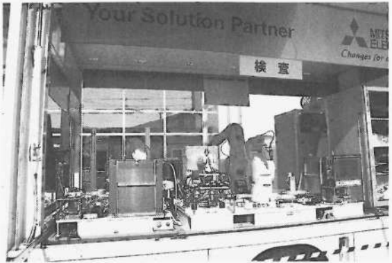
三菱電機はデモカーに産業用ロボットを展示