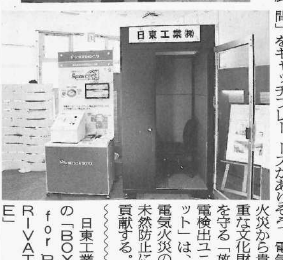
日東工業の「BOX for PRIVATE」は、電気火災の未然防止に貢献する。

光電業が代理店契約を結んでいるユニバーサルロボットの作業実演内も画面を多分割して実演した。